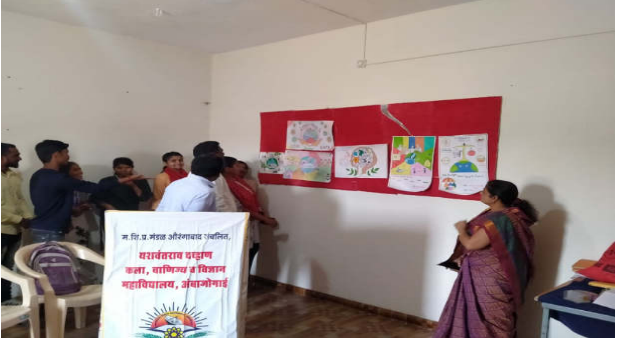
पोषण पखवाडा निमित्त कार्यक्रमात सहभागी राष्ट्रीय सेवा योजना विभागाचे स्वयंसेवक व प्राध्यापक