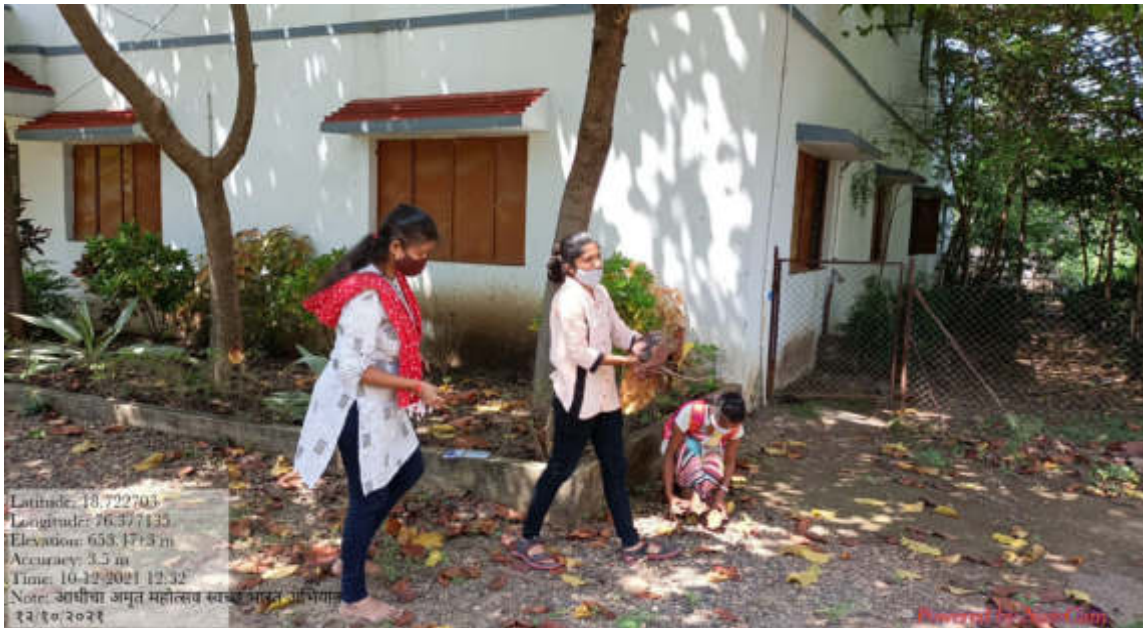
महाविद्यालयाचा परिसर स्वच्छ करतांना राष्ट्रीय सेवा योजना विभागाचे स्वयंसेवक व