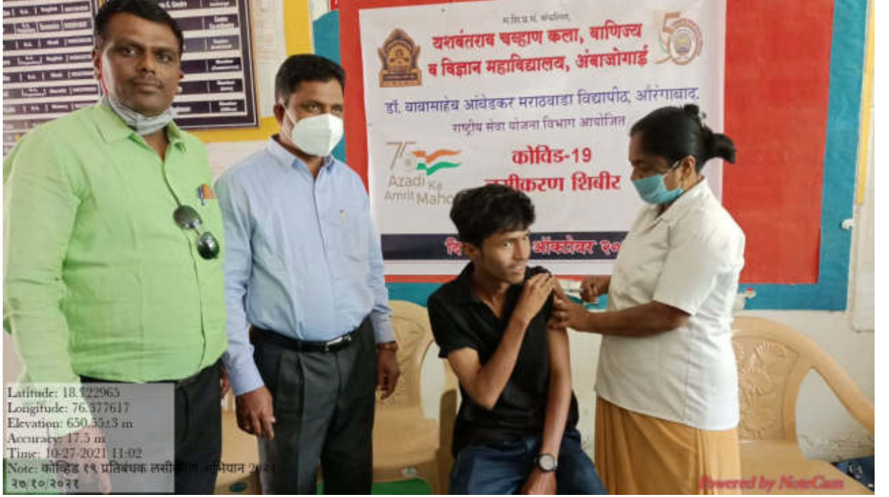
कोविड लसीकरण शिबिरात सहभागी राष्ट्रीय सेवा योजना विभागाचे स्वयंसेवक व प्राध्यापक