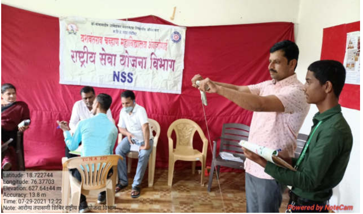
आरोग्य तपासणी शिबिरात तपासणी करतांना राष्ट्रीय सेवा योजना विभागाचे स्वयंसेवक व प्राध्यापक