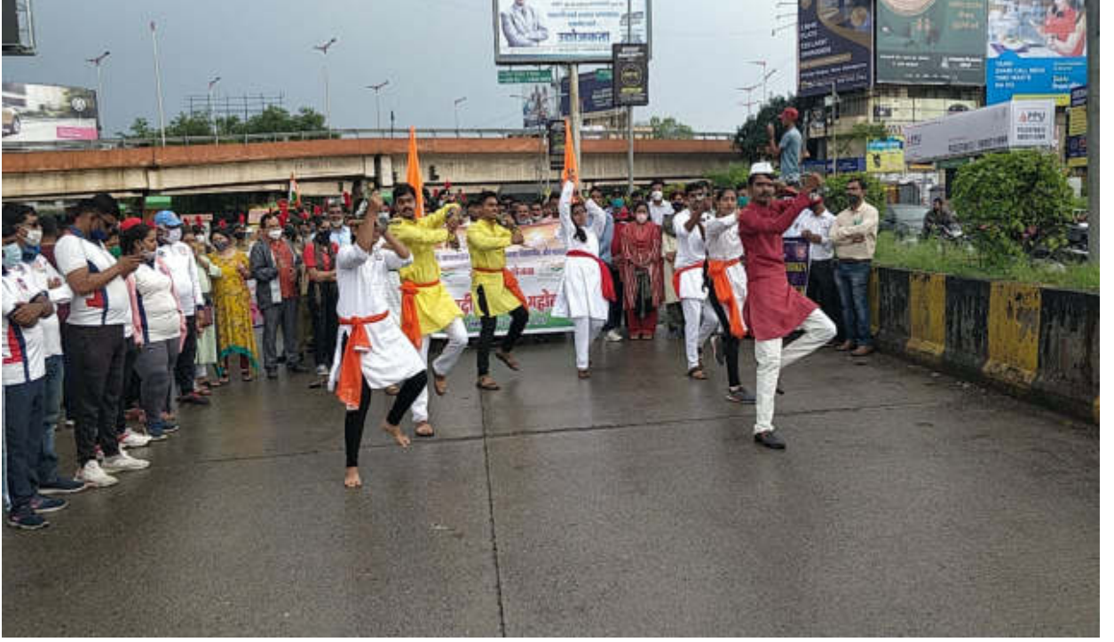
प्रजासत्ताक दिन परेड पूर्व निवड शिविरात सहभागी राष्ट्रीय सेवा योजना विभागाची स्वयंसेवक शेख