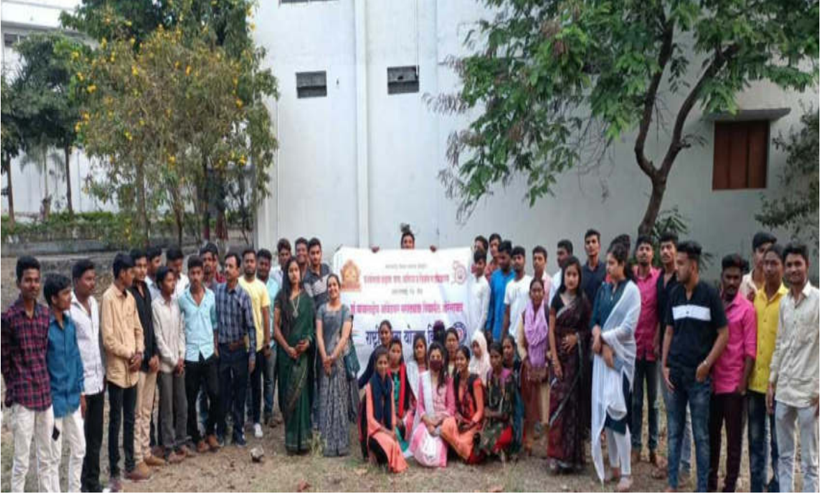
जागतिक महिला दिना निमित्त उपस्थित राष्ट्रीय सेवा योजना विभागाचे स्वयंसेवक व प्राध्यापक