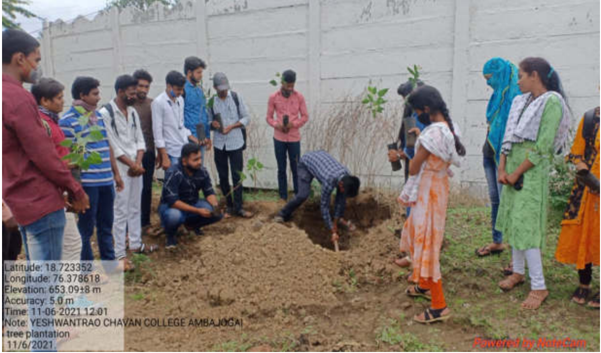
महाविद्यालयाचा परिसरात वृक्षरोपण करतांना राष्ट्रीय सेवा योजना विभागाचे स्वयंसेवक व प्राध्यापक