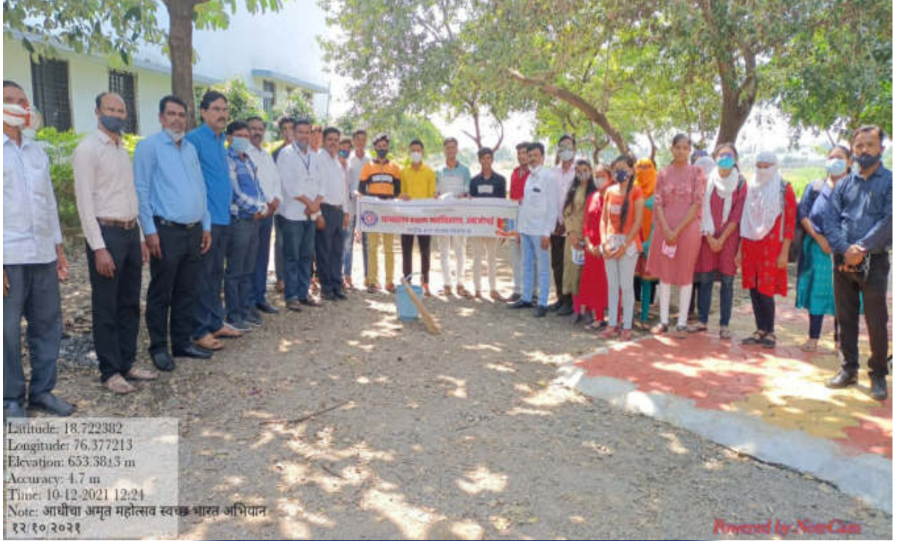
महाविद्यालयाचा परिसर स्वच्छ करतांना राष्ट्रीय सेवा योजना विभागाचे स्वयंसेवक व