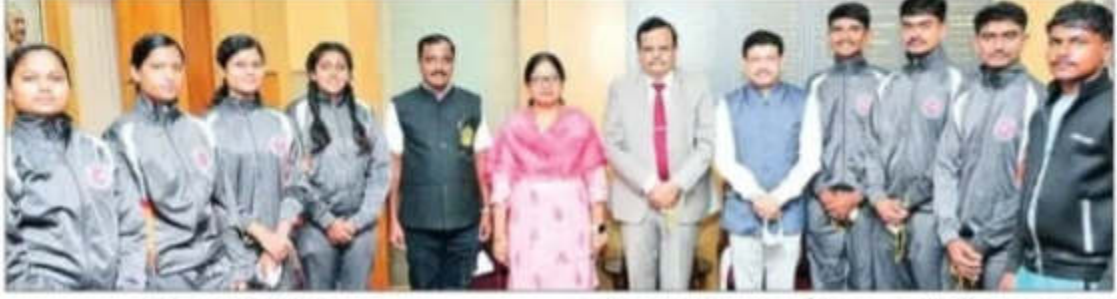
विशेष प्रतिनिधि | औरंगाबाद

कवयित्री बहिणाबाई चौधरी उत्तर महाराष्ट्र विश्वविद्यालय, जलगांव में 12 से 21 अक्टूबर तक आयोजित प्री एनआरडी/एसआरडी शिविर के लिए डॉ. बाबासाहेब आंबेडकर मराठवाड़ा विश्वविद्यालय अंतर्गत आने वाले चार जिलों के 7 स्वयंसेवकों की टीम रवाना हो चुकी है।